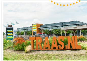
Hoofdkantoor • 's-Gravenpolder